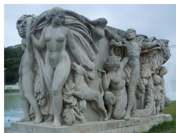
Grand ronde bosse